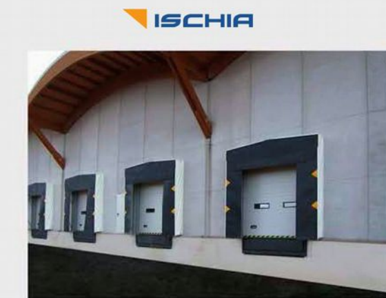
Portali isothermici - Dock shelters - Докшелтеры