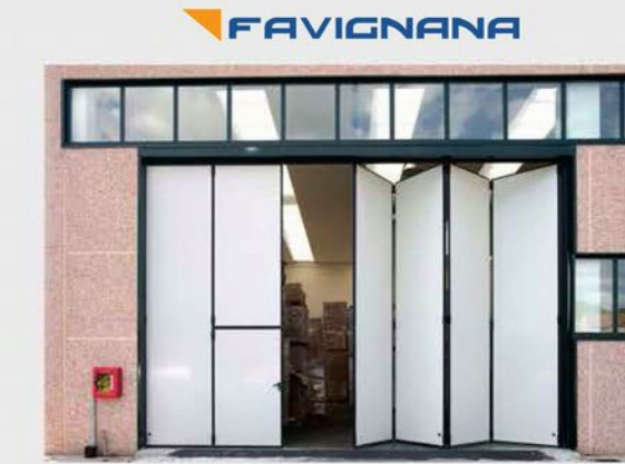
Portoni a libro - Folding doors - Складные двери