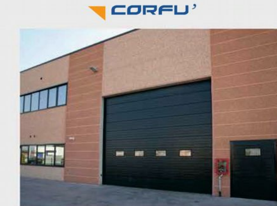
Portoni sezionali - Sectional doors - Секционные ворота