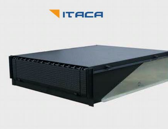
Pedane elettroidrauliche - Dock levellers - Гидравлические рампы

PFI dispone di una gamma completa di chiusure industriali e soluzioni per la logistica. Le tipologie sono varie per soddisfare tutte le esigenze.